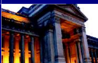
Nueva ley de Carrera Judicial