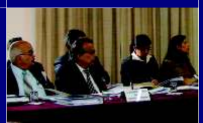
Coordinación para el Control Disciplinario