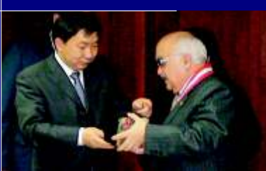
Delegación China visita CNM